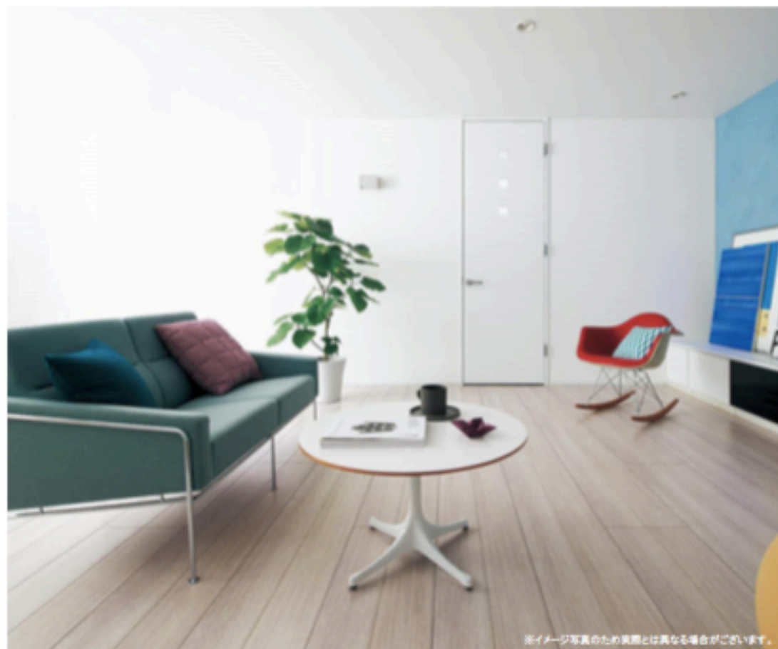
※イメージ写真のため実際とは異なる場合がございます。